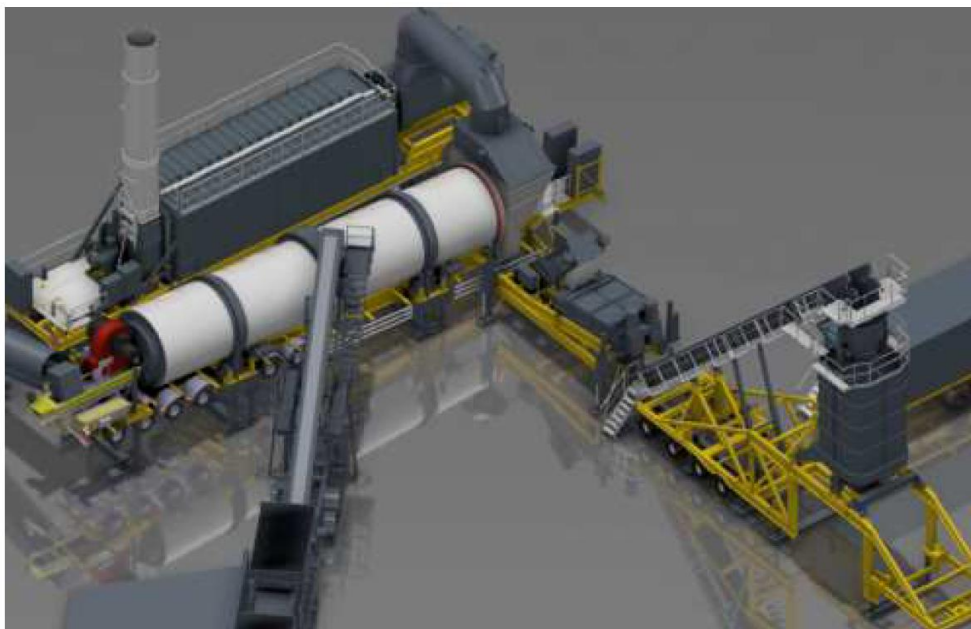
Illustration n° 4 : Centrale continue ERMONT de type TSX28

Les granulats sont repris sur stock et déversés dans des trémies prédoseuses. Leur chargement se fait à l'aide d'un chargeur à godet. Le prédosage a une double fonction :