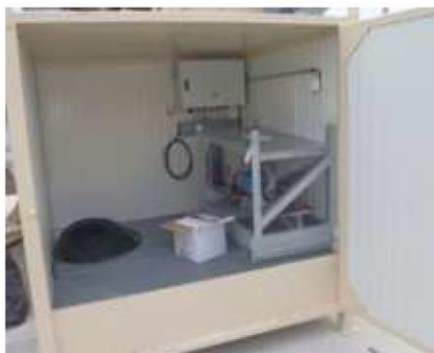
Illustration n° 6 : Exemple de cubitainer pour additifs

L'installation se présente généralement sous la forme d'un ensemble fermé, dimensionné pour accueillir un cubitainer de 900 kg, et disposant d'un bac de rétention intégré.